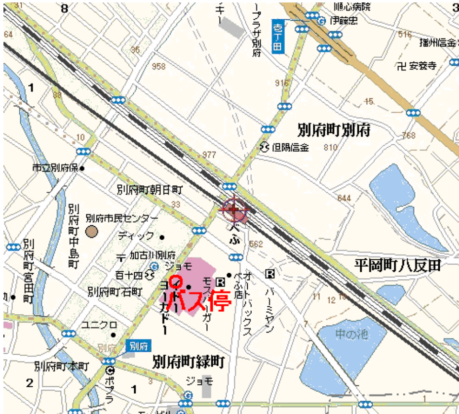
図 山陽電鉄別府駅／神鋼専用バス停

※ 南側にも大きなバス乗り場がありますので、くれぐれもお間違いなきようご注意ください